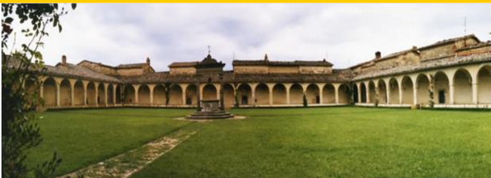
Certosa di Pontignano (SI) – Sede del Master